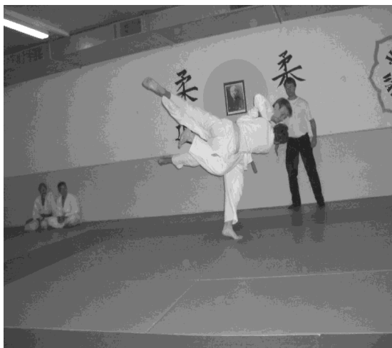
Ein klassischer Harai-Goshi

Dementsprechend schön war es, wenn dieses einfache Prinzip angewendet wurde und sofort zu einem Punkt oder gar dem vorzeitigen Sieg (Ippon) führte. Für alle war es ein lehrreiches Turnier, konnten doch die im Training erlernten Techniken ausprobiert und erfahren werden, wann eine Technik geht und wann nicht.