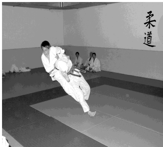
Wer wirft hier wen?

Kurz darauf starteten die ersten Wettkämpfe. Jedes Kind bestritt in den kommenden zwei Stunden mindestens drei Randoris. Spannende Zweikämpfe hielten die zahlreich anwesenden Zuschauer gespannt auf ihren Plätzen sitzen.