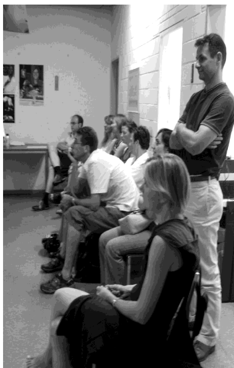
Gespannt verfolgen die Eltern die Prüfung

Herzliche Gratulation, es war schön zuzuschauen.