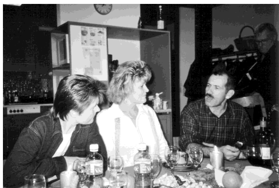
Angeregte Gespräche bis spät in den Abend

Was war das für ein Klingeln? Kam da der Samichlaus? Ja, er war's. Mit seiner roten Kutte bahnte er sich den Weg zu den anwesenden Mitgliedern. Hmm, was wird er wohl über mich erzählen?