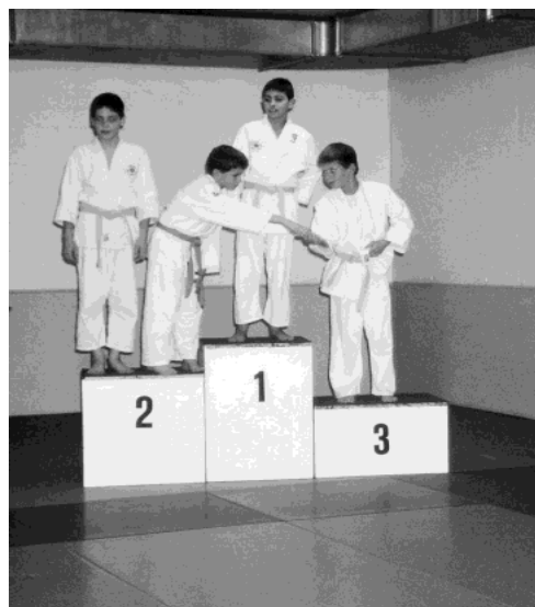
Fair gratulieren sich auch die Kinder untereinander

unaufmerksam und so lagen auch die höher Gradierten am Boden. Das ist das schöne am Judo-Sport. So war es dann auch nicht verwunderlich, dass einige Tränen flossen, als das selber gesteckte Ziel nicht erreicht wurde. Doch bei der Preisverteilung war dies schon wieder vergessen, und mit Stolz wurde die Medaille entgegengenommen.