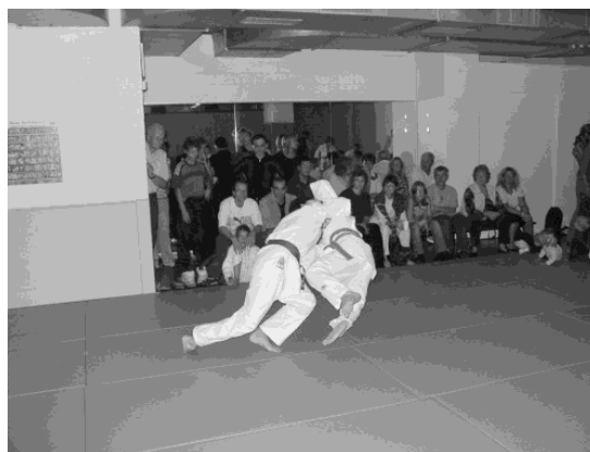
Viele Zuschauer und teilweise spektakuläre Würfe

Glücklicherweise mussten keine grösseren Verletzungen verzeichnet werden. Ein blaues Auge war die positive Unfallbilanz.